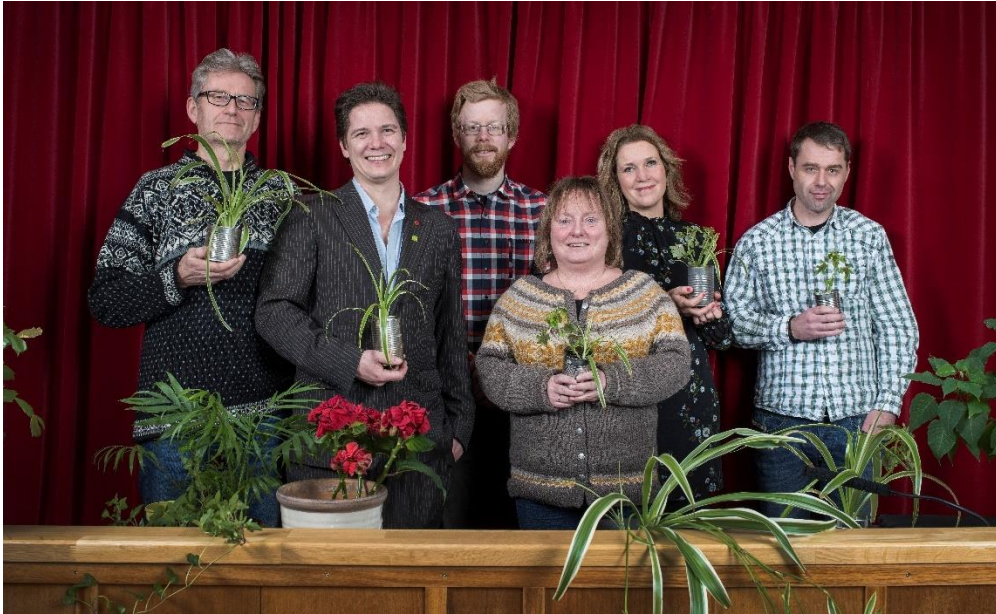
Topp listekandidater 2019 i Ringsaker MDG